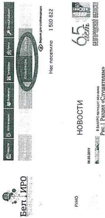
Рис.1 Раздел «Слушателям»