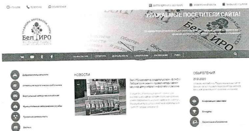
Рис.1 Раздел «Слушателям»

3) выбрать вкладку «Платные образовательные услуги» (рис.2).