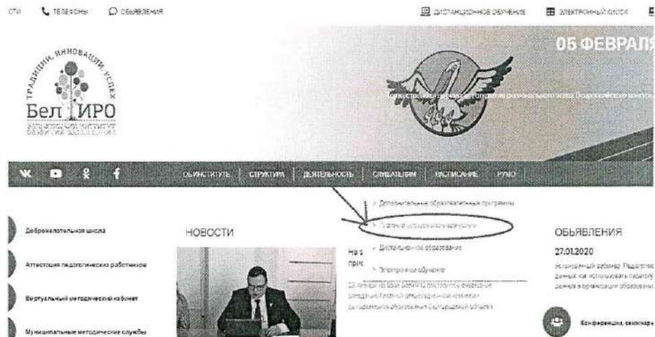
Рис.2 Раздел «Платные образовательные услуги»