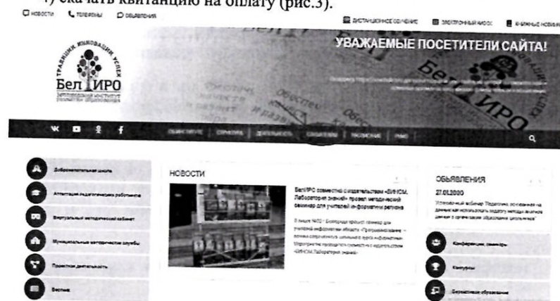
Рис.1. Раздел «Слушателям»