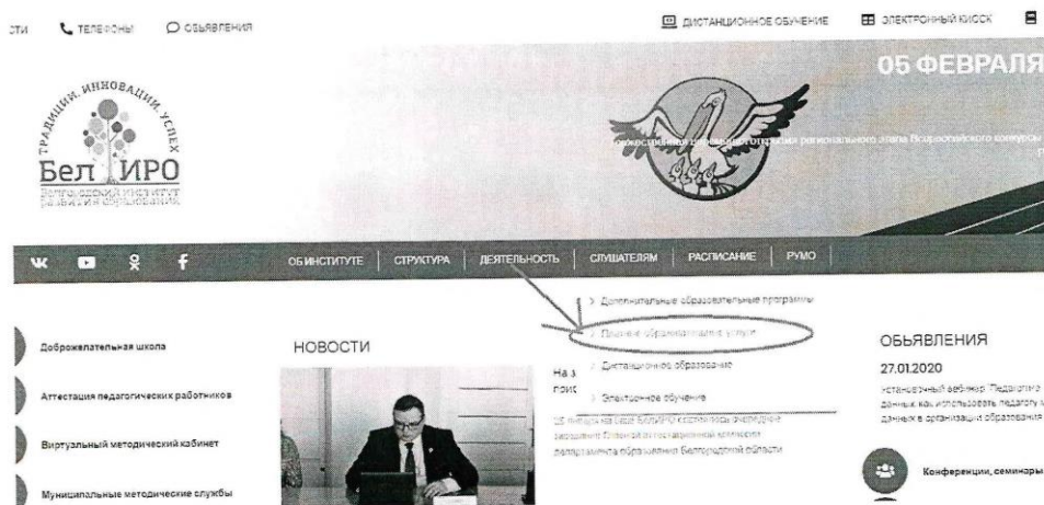
Рис.2 Раздел «Платные образовательные услуги»