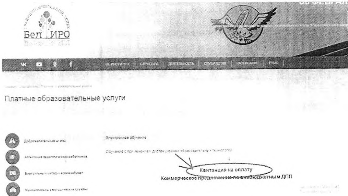
Рис.3 Квитанция на оплату

Сканированную копию квитанции об оплате или скриншот подтверждения оплаты за участие направить на адрес tsenterktpo@beliro.ru