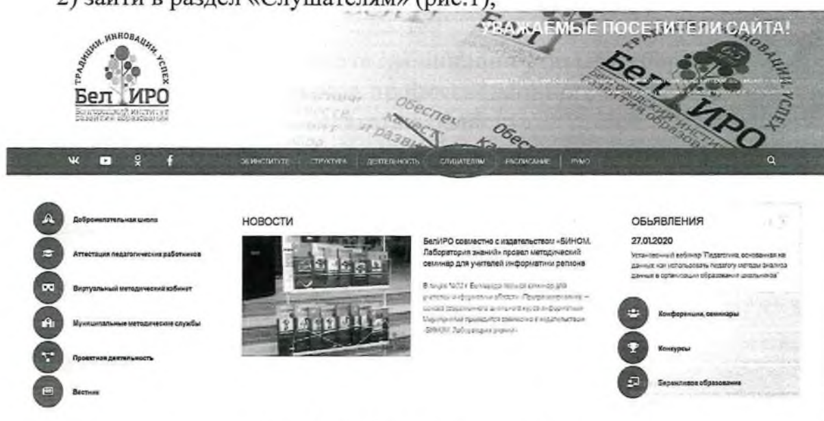
Рис.1. Раздел «Слушателям»