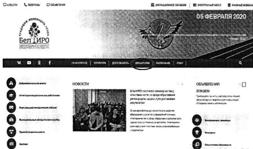
Рис.1 Раздел «Слушателям»

3) выбрать вкладку «Платные образовательные услуги» (рис. 2).