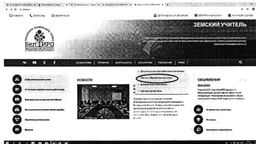
Рис. 2 Раздел «Платные образовательные услуги»

3) выбрать вкладку «Платные образовательные услуги» (рис. 2).