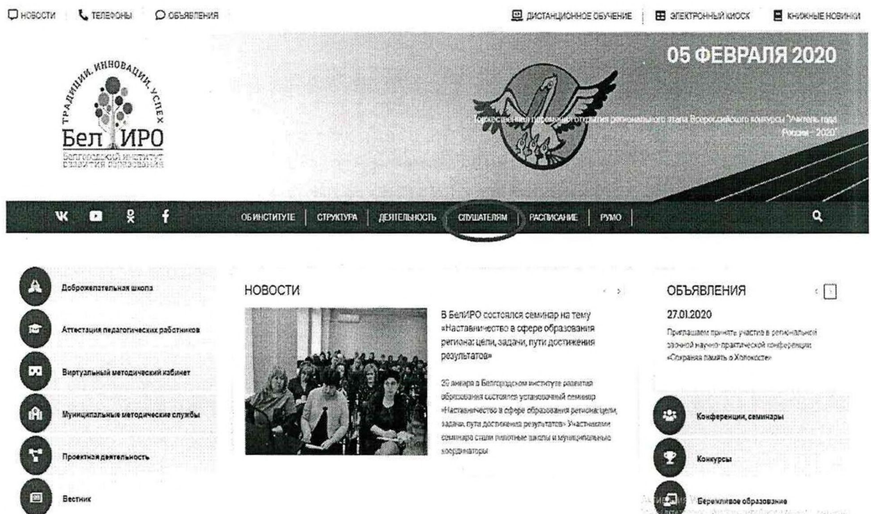
Рис.1 Раздел «Слушателям»