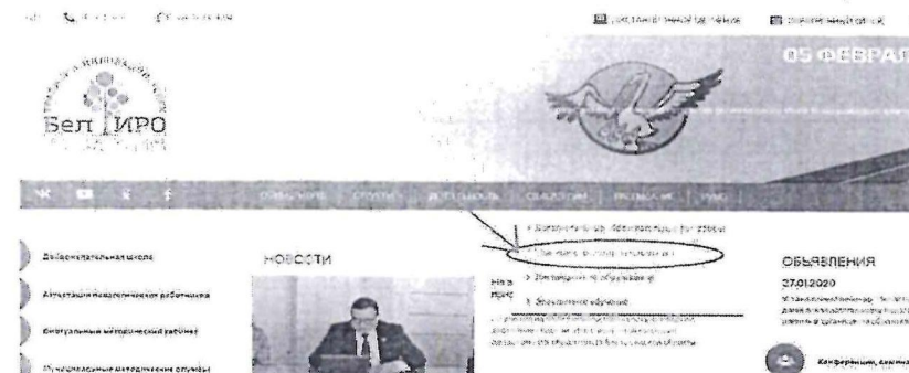
Рис.2 Раздел «Платные образовательные услуги»