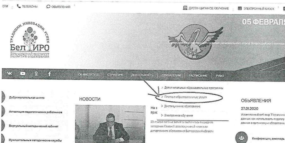
Рис. 2. Раздел «Платные образовательные услуги»

2. Оплатить организационный взнос, используя услуги банка, онлайн версии услуг банка или мобильный телефон, указав следующую информацию: