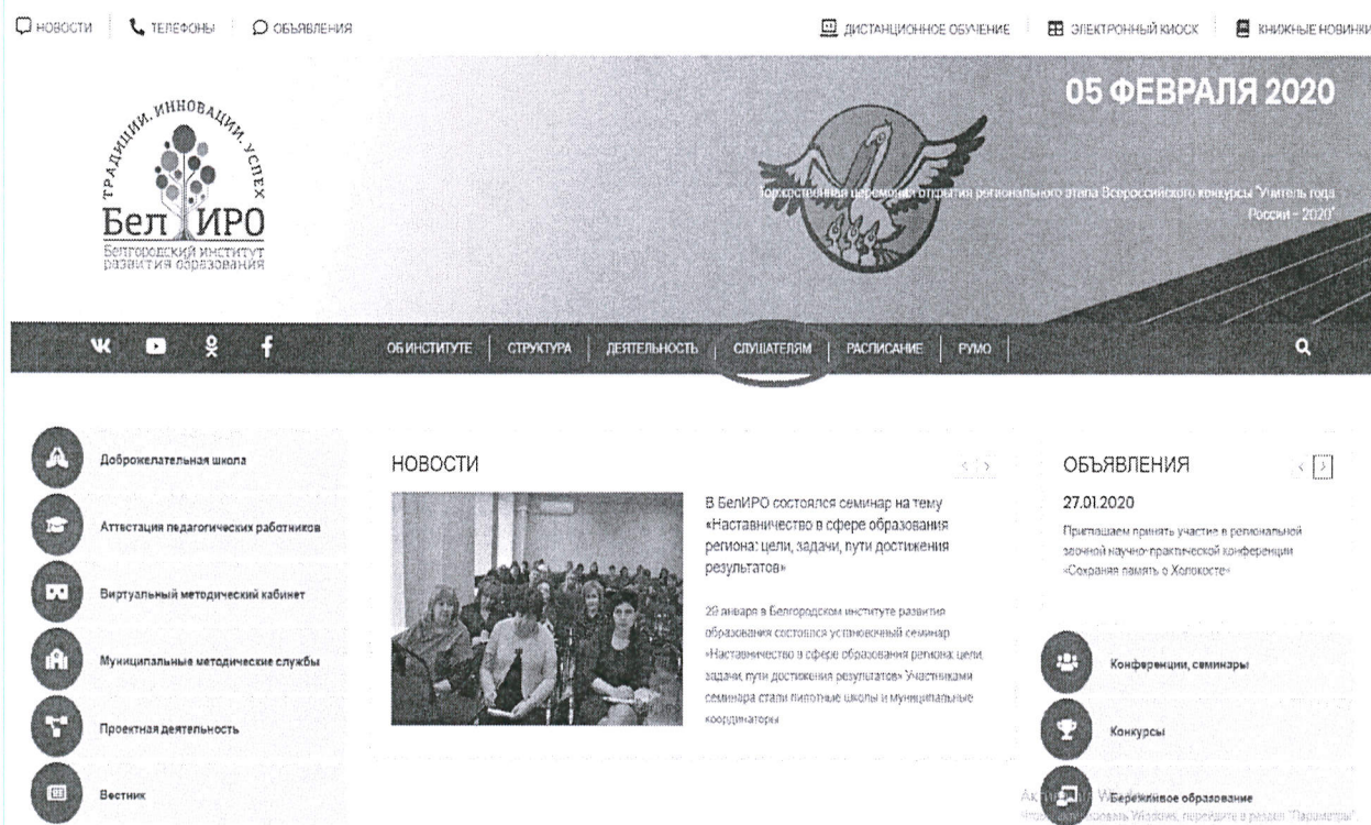
Рис.1 Раздел «Слушателям»