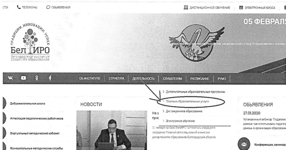
Рис.2 Раздел «Платные образовательные услуги»