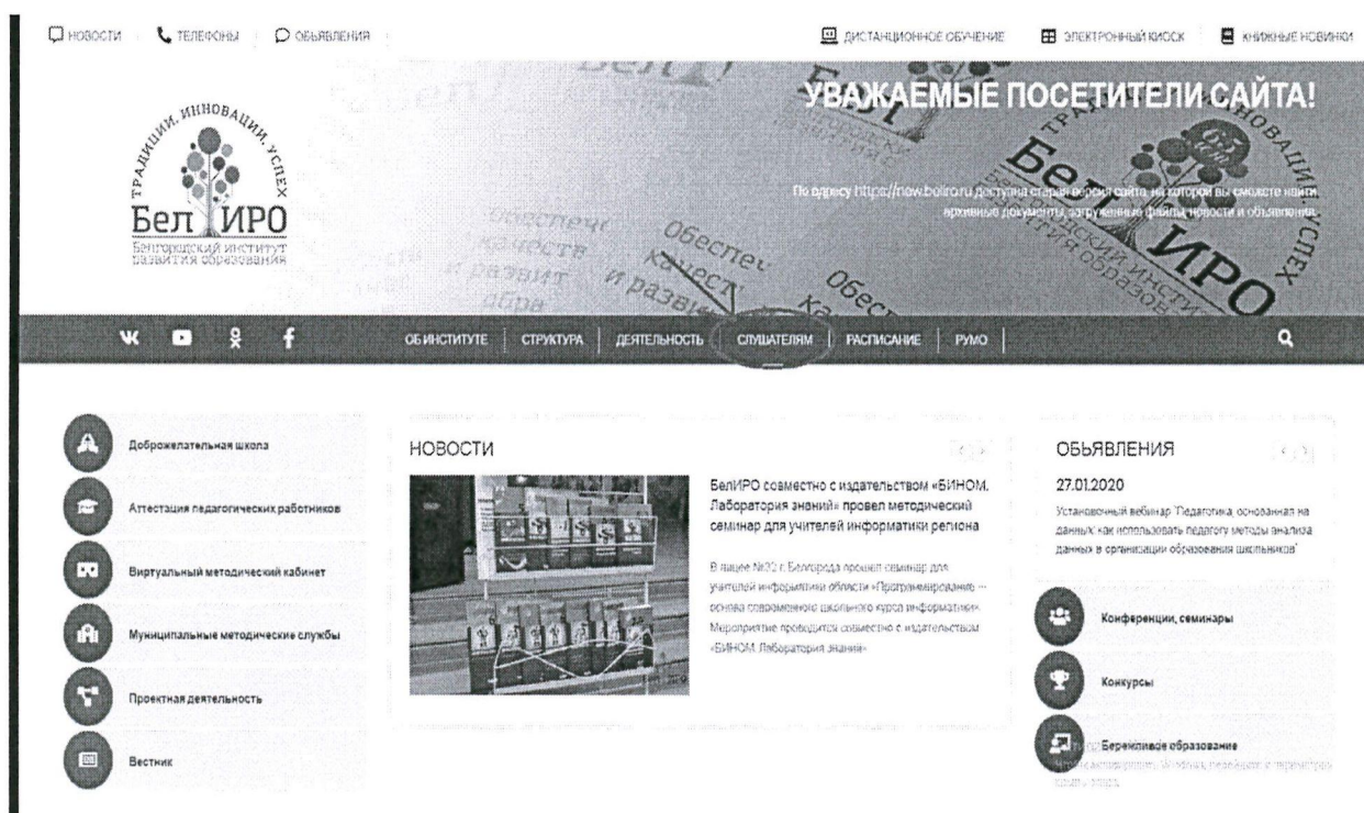
Рис.1 Раздел «Слушателям»

2. Оплатить организационный взнос, используя услуги банка, онлайн версии услуг банка или мобильный телефон, указав следующую информацию: