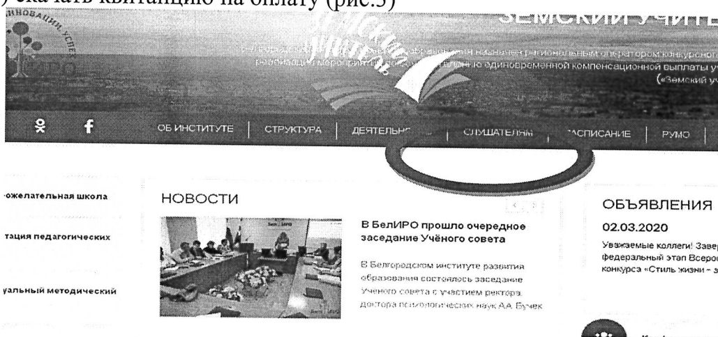
Рис.1 Раздел «Слушателям»