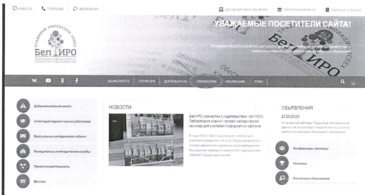
Рис.1 Раздел «Слушателям»

2. Оплатить организационный взнос, используя услуги банка, онлайн версии услуг банка или мобильный телефон, указав следующую информацию: