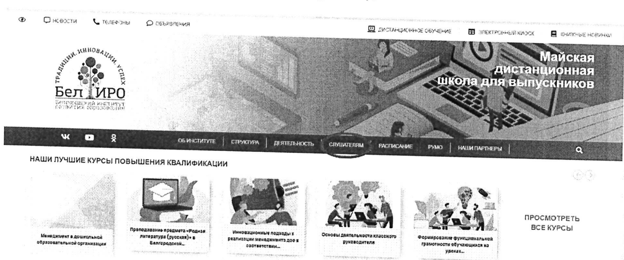
Рис.1 Раздел «Слушателям»