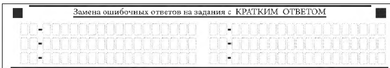
Рис. 12. Нижняя часть бланка ответов № 1 (поле замены ошибочных ответов на задания с кратким ответом)

В нижней части бланка ответов № 1 предусмотрены поля для записи исправленных ответов на задания с кратким ответом взамен ошибочно записанных (рис. 12).